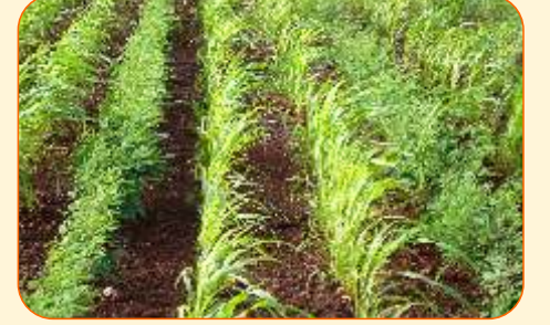
ज्वारी + तुर (२:१)