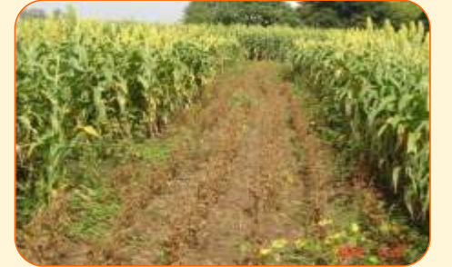
ज्वारी + सोयबीन (३:६)