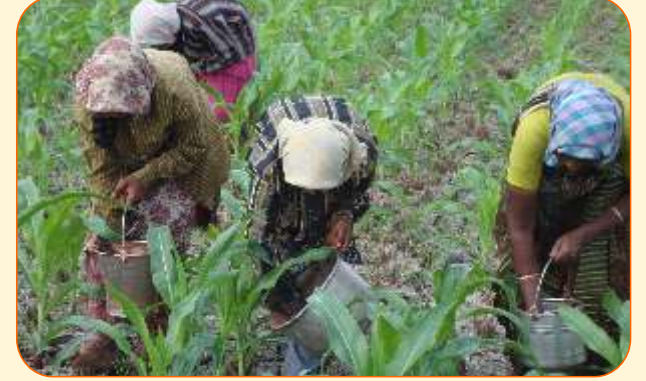
रासायनिक खतांचा वापर