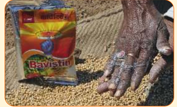
ज्वारी बिज प्रक्रिया