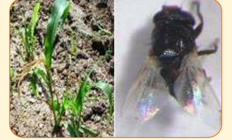
खोडमाशी प्रभावीत पिक