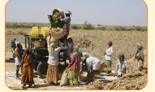
यंत्राद्वारे ज्वारीची मळणी