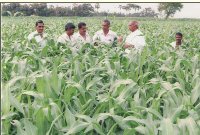
Farmers being briefed about improved cultivation practices in rice fallows

Sorghum field day was organized by DSR on crop management practices for rabi sorghum in rice-fallows at Peteru Village in Repalle Mandal, Guntur District, Andhra Pradesh on 21 February 2011. About 25 farmers from the Guntur district participated in this programme. The crop was sown on 26 December, 2010 with sorghum variety Mahalaxmi. Farmers reported on the incidence of Stem-borer and insignificant