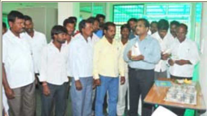
Farmers being explained about various food products of sorghum

Farmers from Ibrahimabad : Twenty five farmers from Ibrahimabad Mandal, Medak district, AP under NAIP sub-Project on "Sweet sorghum ethanol value chain development