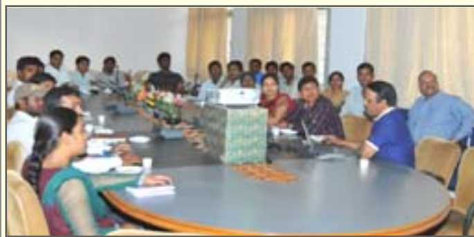
Students keenly listening to the finer aspects of plant variety protection

Trainees : A group of 34 trainees undergoing diploma programme at Vibha Seeds, Hyderabad visited DSR on 2