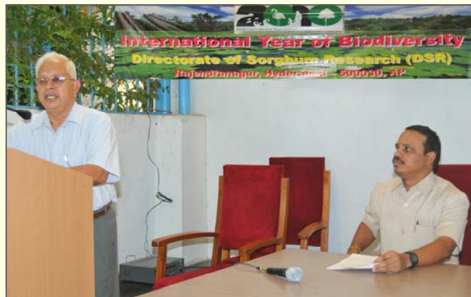
Director, DSR addressing staff on the eve of "International Biodiversity Day"

The United Nations has proclaimed May 22 as an International Day for Biological Diversity (IDB) to increase understanding and awareness of biodiversity issues. Moreover, this year, 2010 has been designated as the United Nations (UN) International Year of Biodiversity. This is a great opportunity to draw public attention to the issues at stake. To mark this