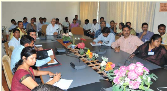
Trainees being shown a film on "Sorghum Production Technology" and "Sweet sorghum: Ethanol Production"

Forty four newly recruited ARS scientists of ICAR belonging to 90 th batch of the FOCARS visited DSR on