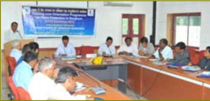
Director, DSR giving his inaugural address

Training-cum-orientation programme on "Biology and Management of Biotic Interactions in sorghum" was