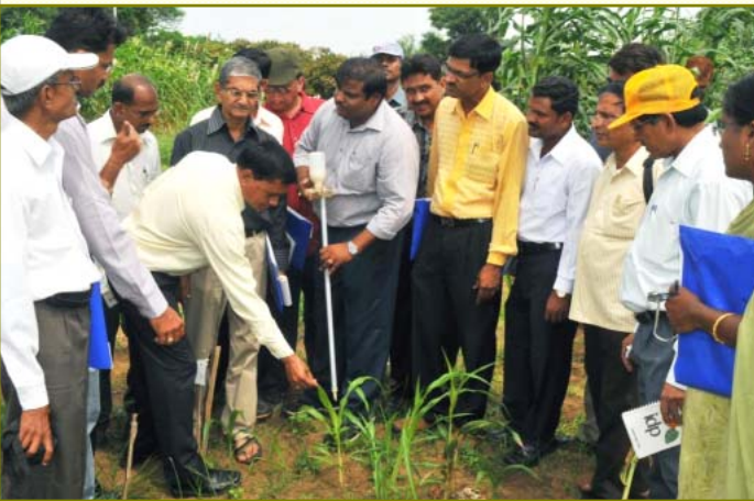
Stem borer larval infestation through bazooka being demonstrated to trainees

organized at DSR, Hyderabad on 16-17 September, 2011. About 50 plant protectionists, from different