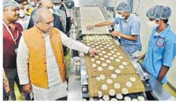
హైదరాబాద్ రాజేంద్రనగర్ లోని తృణధాన్యాల పరిశోధన కేంద్రంలో ఆహారోత్పత్తుల తయారీని పరిశీలిస్తున్న కేంద్ర వ్యవసాయశాఖ మంత్రి తోమర్

ఈనాడు, హైదరాబాద్: "ప్రజలకు నాణ్యమైన బియ్యం ఇవ్వాలి. అందుకే ఆలాంటి బియ్యాన్ని మాత్రమే కేంద్రం కొంటుంది" అని కేంద్ర వ్యవసాయశాఖ మంత్రి నరేంద్ర సింగ్ తోమర్ స్పష్టం చేశారు. 'ఉప్పుడు(బాయిల్డ్) బియ్యాన్ని కేంద్రం ఎందుకు కొనడు, తెలుగు రైతులకు అన్యాయం జరుగుతుంది, రైతులు ఆందోళనలో ఉన్నారు కదా' అని 'ఈనాడు' అడుగగా.. దొడ్డు బియ్యం కొనేది లేదని ఆయన తెలిపారు. "పేదలకు పోషకాహారం అందించేందుకు తృణధాన్యాలను రేషన్ కార్డులపై రాష్ట్ర ప్రభుత్వం విక్రయిస్తే.. ఈ పంటలను రైతుల నుంచి మద్దతు ధరకు కేంద్రం కొంటుంది" అని స్పష్టం చేశారు. రేషన్ కార్డులపై విక్రయిస్తే సజ్జలను కిలో రూపాయికే ఇస్తామని మంత్రి వివరించారు. హైదరాబాద్ హైటెక్స్ లో శుక్రవారం 'జాతీయ పోషక తృణధాన్యాల భాగస్వాముల మేగా సదస్సు'కు తోమర్ ముఖ్యఅతిథిగా హాజరై ప్రసంగించారు. అనంతరం మీడియా సమావేశంలో మాట్లాడుతూ..