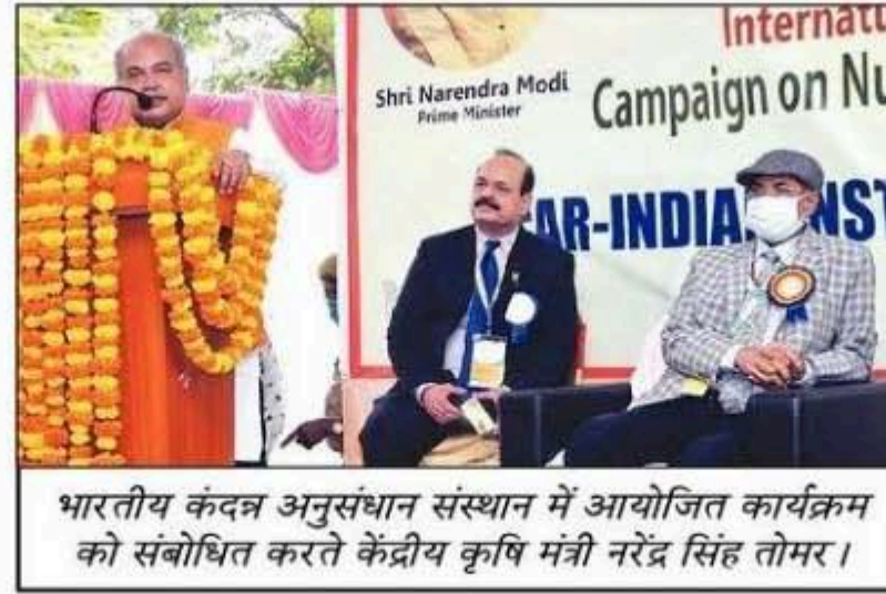
भारतीय कदन्न अनुसंधान संस्थान में आयोजित कार्यक्रम को संबोधित करते केंद्रीय कृषि मंत्री नरेंद्र सिंह तोमर।

तोमर ने कहा कि स्वामी विवेकानंद ने कहा था, 21वीं सदी भारत की होगी, अब मोदी के नेतृत्व में भारत के उत्कर्ष का समय नजदीक है। सभी को मिलकर