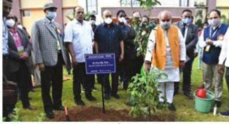
భారత తృణధాన్యాల సంస్థలో మొక్కనాటి నీరు పోస్తున్న కేంద్రమంత్రి సరేంద్రసింగ్ తోమర్

హైదరాబాద్, సెప్టెంబరు 17, ప్రభాతవార్త: రాష్ట్రంలో రికార్డు స్థాయిలో 20 లక్షల ఎకరాల విస్తీర్ణంలో ఆయిల్ ఫాం ప్లాంటేషన్ చేపడుతున్నందున, ఈ ప్లాంటేషన్ కు విదేశాల నుంచి దిగుమతి చేసుకునే ఆయిల్ ఫాం విత్తనాలకు కస్టమ్స్ సుంకాన్ని తగ్గించేలా తగు చర్యలు తీసుకోవాలని కేంద్ర వ్యవసాయ