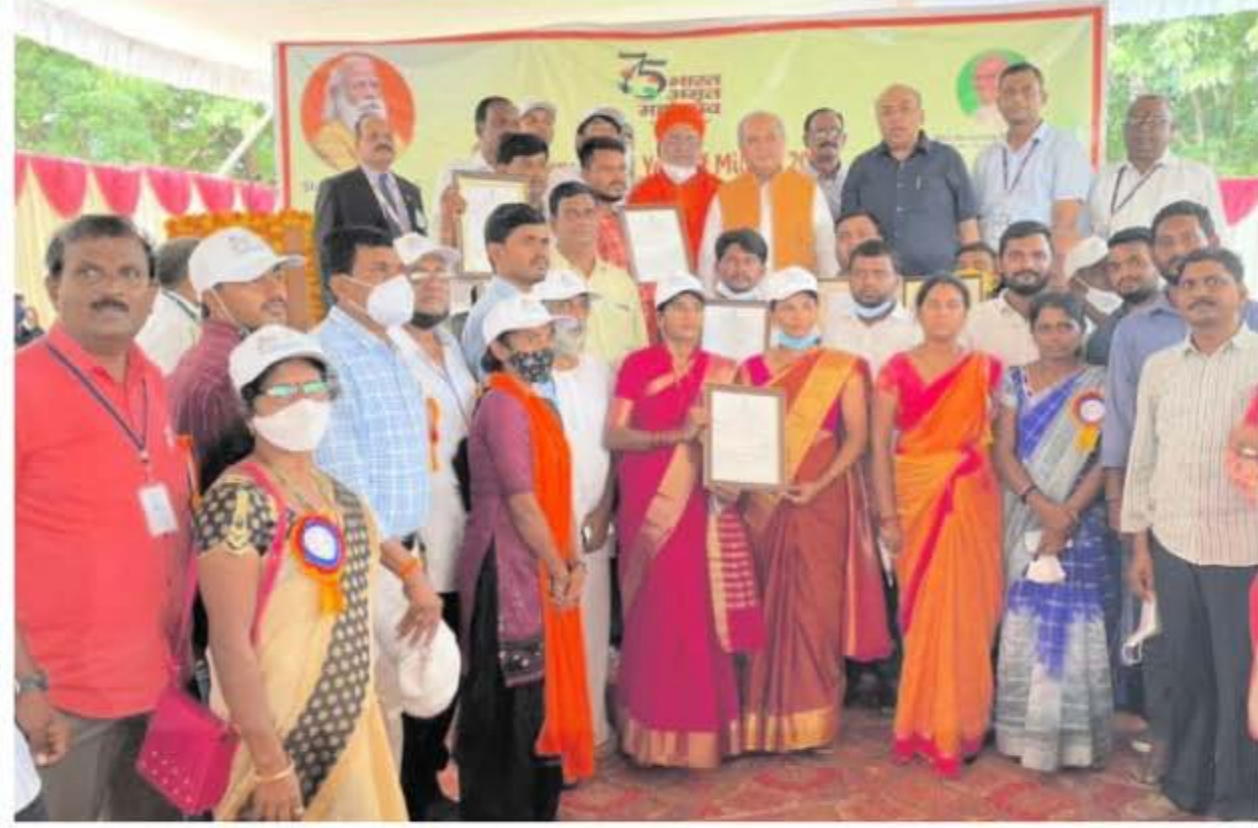
प्रधानमंत्री श्री नरेंद्र मोदी जी के जन्मदिन के अवसर पर आज भारतीय कदन्न अनुसंधान संस्थान (IIMR), हैदराबाद द्वारा आयोजित पोषण वाटिका कार्यक्रम में IIMR व राष्ट्रीय कृषि विस्तार प्रबंध संस्थान (मैनेज) की 71 छात्राओं व सक्कह की महिला सदस्यों का स्वागत-सम्मान केंद्रीय कृषि एवं किसान कल्याण मंत्री श्री नरेंद्र सिंह तोमर ने किया।